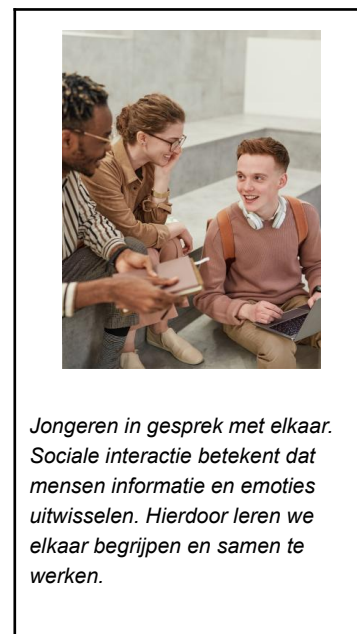
Jongeren in gesprek met elkaar. Sociale interactie betekent dat mensen informatie en emoties uitwisselen. Hierdoor leren we elkaar begrijpen en samen te werken.

We onderzoeken niet alleen negatieve vormen (zoals pesten of ruzie), maar ook positieve en constructieve sociale interacties , zoals samenwerken, vriendschappen sluiten en elkaar steunen. Daarnaast bevat dit hoofdstuk meerdere infoblokken met interessante feitjes of definities, opdrachten om zelf mee aan de slag te gaan, reflectiemomenten om na te denken over je eigen ervaringen, en bonusopdrachten voor extra verdieping.